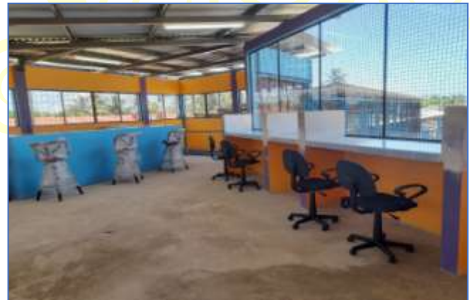
Vista interna del área V.I.P y cabina central, donde se aprecia su equipamiento, luminarias, pintura.