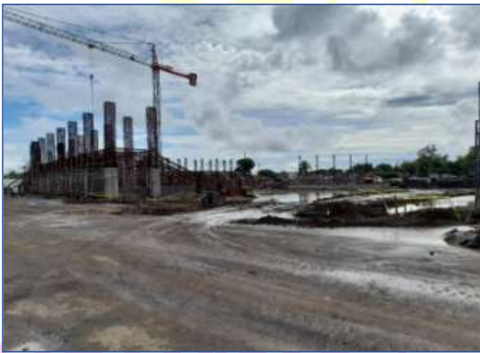
Vista exterior de la gradería central.

El proyecto presenta un atraso del 7%. El núcleo central correspondiente a las áreas constructivas A, B y C son las que presentan más avances, las áreas constructivas laterales son las más desfasadas en su ejecución. Persiste el problema de reubicación de las familias asentadas en el sector norte del campo de béisbol, provocando atrasos en el inicio del muro en este sector