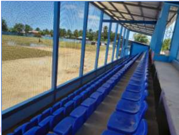
Vista panorámica del área de gradería techada, donde se aprecia la instalación de las butacas.

Se tiene previsto finalice la obra en el mes de julio.