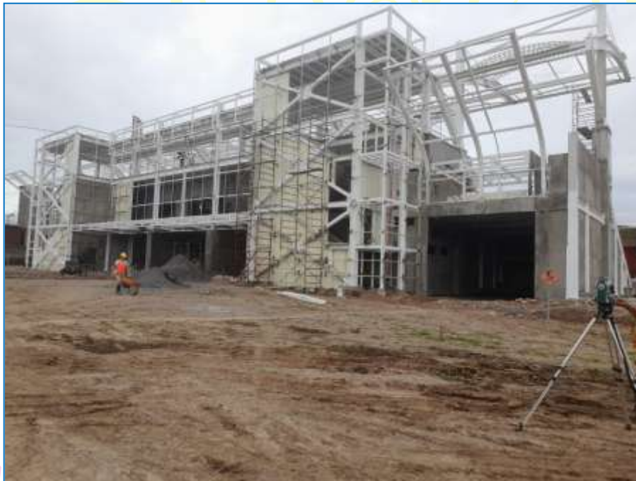
Vista panorámica de gradería, donde se aprecia la estructura metálica de techo.

Se tiene previsto reiniciar la ejecución de las obras en el mes de Julio 2022.