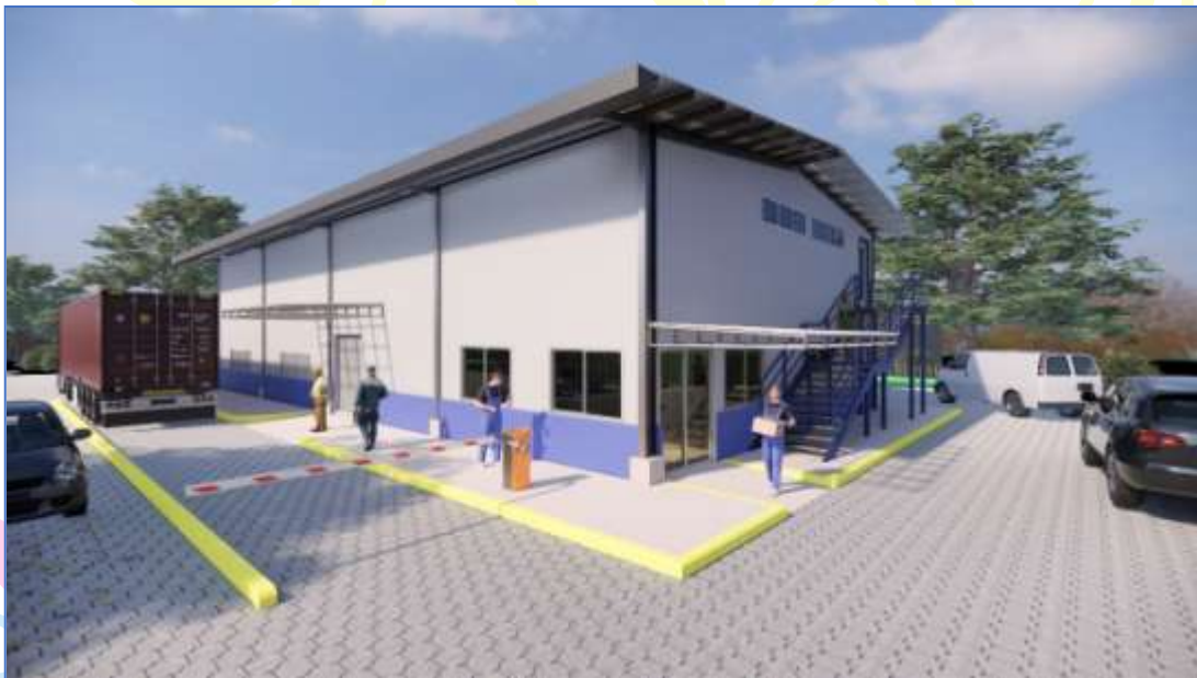
Render de la Vista exterior de las Oficinas de Servicios Generales, Almacén y Transporte.

Los edificios estarán diseñados con un sistema estructural seguro de estructura metálica y concreto reforzado con cerramientos livianos y termo acústicos, sistema de climatización tipo casete, sistemas especiales como voz, datos, internet, circuito cerrado de televisión (CCTV), accesible para personas con discapacidad.