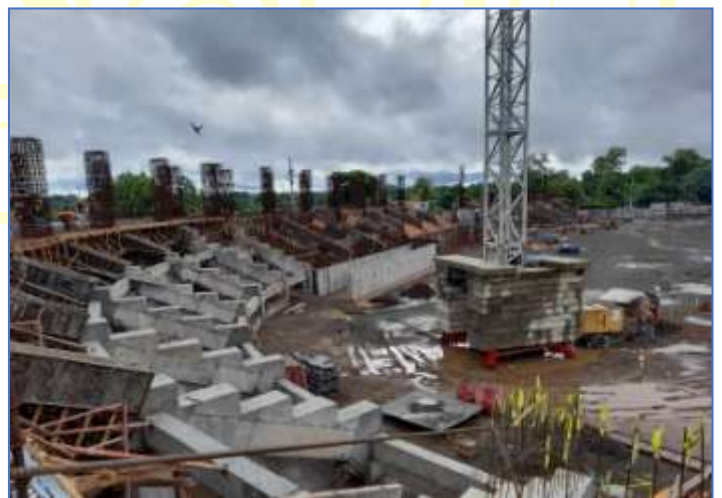
Vista panorámica del área de gradería central, donde se aprecia la construcción de vigas raker.